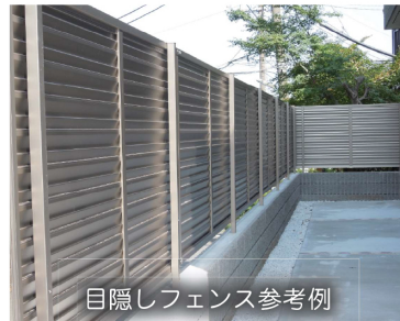
目隠しフェンス参考例