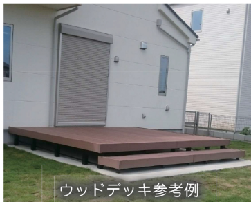
ウッドデッキ参考例