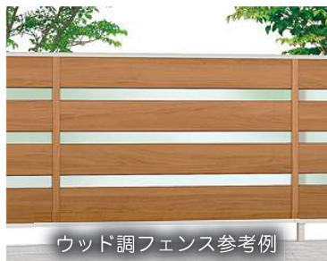
ウッド調フェンス参考例