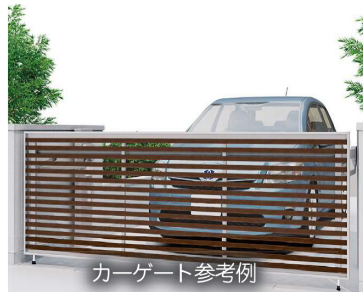
カーゲート参考例