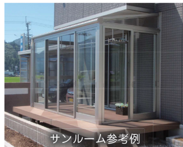
サンルーム参考例

※外構工事は現場での打ち合わせが必要となります。 ※品物代のほかに施工費用がかかります。